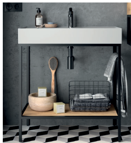
Struttura a terra, lavabi 800 portasciugamani a destra