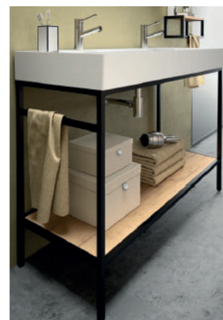
Struttura a terra lavabi 1200 (2 rubinetti) portasciugamani a destra